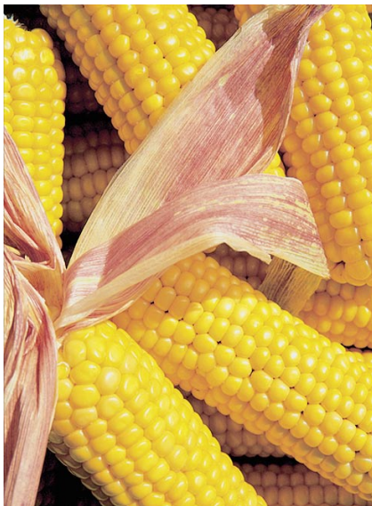
Mais – ein Grundpfeiler in der glutenfreien Diät.

Überzug von Nahrungsmitteln vorhanden sein. Beim Einkaufen muss jede Deklaration gelesen und auf eine allfällige glutenhaltige Zutat geprüft werden. Im Zweifelsfall sollte man auf das Produkt verzichten. Gewähr bieten die Spezialprodukte mit dem Label der durchgestrichenen Ähre auf kontrollierten Spezialprodukten, die den Grenzwert von 20 mg Gluten pro 100 g Trockenmasse einhalten. Diese sind allerdings vier bis sieben Mal teurer. Probleme bereiten fehlende Deklarationen bei Produkten im Offenverkauf, Rezepturänderungen, das Essen in Restaurants, Kantinen, auf Reisen und im Ausland sowie von Natur aus glutenfreie Nahrungsmittel, die während der Verarbeitung mit Gluten kontaminiert werden können.