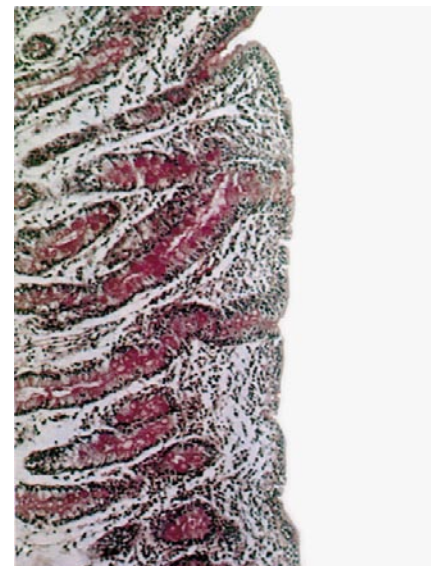
Gewebeschnitt durch eine flache, zottenlose Dünndarmschleimhaut mit stark reduzierter Fläche zur Nährstoffaufnahme.

Die Betroffenen müssen glutenhaltige Getreide sowie alle daraus hergestellten Nahrungsmittel konsequent vermeiden. Bereits kleinste Mengen Glu-